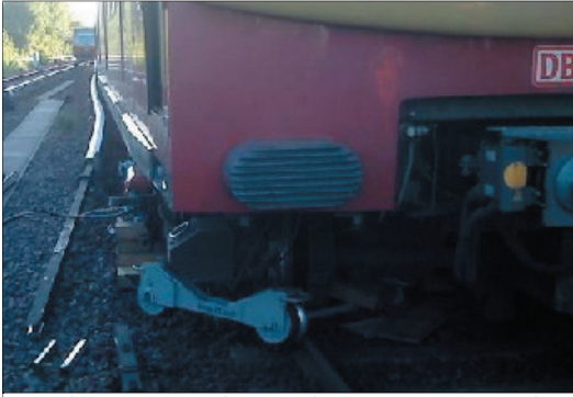
Bei der Bergung des entgleisten Zug mit Radscheibenbruch, entgleiste er ein zweites Mal