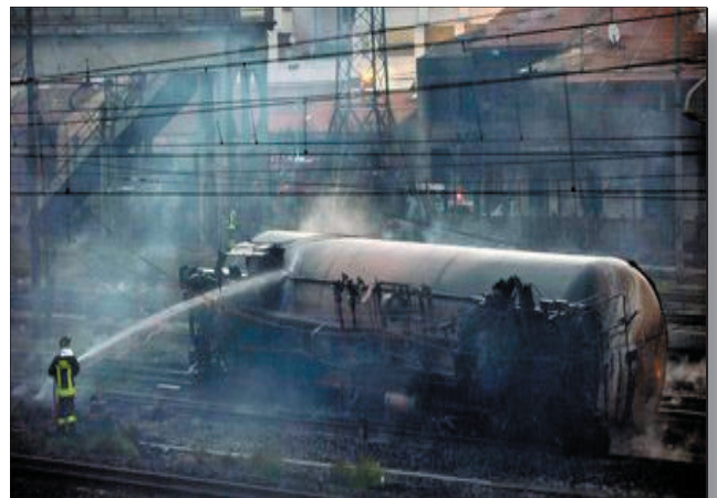
Das EBA informierte die Bahnbetreiber im Vorfeld über brüchige Achsen bei 60.000 Güterwaggons.

Es sind weitere Ausnahmezustände bei der Bahn zu erwarten. So sollten wir Eisenbahner uns daran erinnern, wie die Bahn einst funktioniert hat und wieder funktionieren kann. Wir wissen es am Besten, wo es klemmt und wo es brennt. Warum sollen es immer wir sein, die im nachhinein Feuerwehr spielen und die verbrannte Erde zusammen fegen? Wir sollten zukünftig jedem auf die Finger hauen, der an der Bahn und an unseren Arbeitsplätzen zündeln will! Die Entscheidungsträger sollten wir selber sein, auch wenn wir es uns noch nicht zutrauen. So sind wir es, die am besten wissen wie die Bahn tagtäglich am Rollen gehalten werden kann. Auch ohne Geschäftsführer.